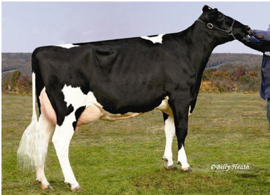
COOKIECUTTER GLD HOLLER FOURTH DAM