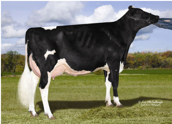
COOKIECUTTER MOM HALO THIRD DAM